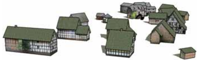
Der Westerwald als virtuelles Modell

Später soll anhand des 3D-Modells die beste Perspektive gefunden werden, um dem Besucher direkt beim Eintritt ins Museum Orientierung zu bieten. Die Tafel am Museumseingang soll den Besuchern spontan und intuitiv einen Überblick verschaffen. Freilich ist hierfür die Mitarbeit professioneller Grafiker wertvoll. Für ihre Arbeit wird das Modell gedreht, geneigt, auch mal gestaucht, gedehnt