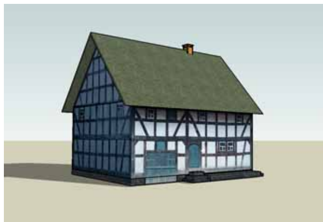
Das Modell Haus aus Eulenbruch