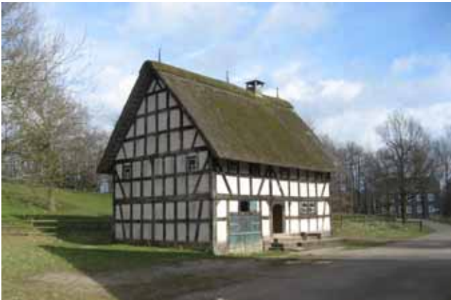
Haus aus Eulenbruch im LVR-Freilichtmuseum Kommern

□ Was haben wir für Augen gemacht, als die ersten Kelchprofile um sich selber kreisend ein dreidimensionales Computermodell erzeugten. Das war Ende der 70er Jahre. Seitdem ist viel geschehen. Das Computer-Aided-Design – kurz: CAD – wurde zum Standardwerkzeug für Architekten und mit ihm die Visualisierung architektonischer und städtebaulicher Entwürfe.