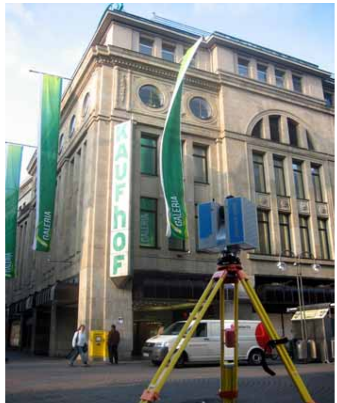
Galeria Kaufhof Köln, Hohe Straße. Das größte Warenhaus der Domstadt.

Hierfür reicht es freilich nicht, die vorhandenen und bisweilen digital vorliegenden Archivunterlagen zu verwenden. Als Überblick und Studium der Grundrissteilung leisten sie wertvolle Dienste. Als Grundlage einer Planung, die sich später 1:1 in die Wirklichkeit über-